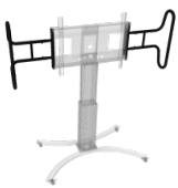
Zwei große, stabile Griffe