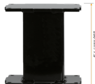
Extender für Aluminiumhubsäulen