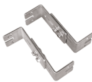
Montagesatz aus verstellbaren Wandhalterungen