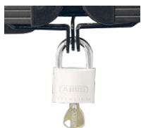
Halterungen und Flügelverschluss