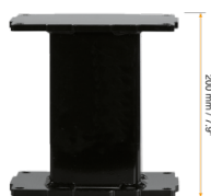
Extender für Aluminiumhubsäulen