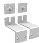
2 verzinkte Wandhalterungen