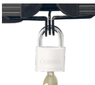
Halterungen und Flügelschloss