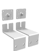
2 verzinkte Wandhalterungen